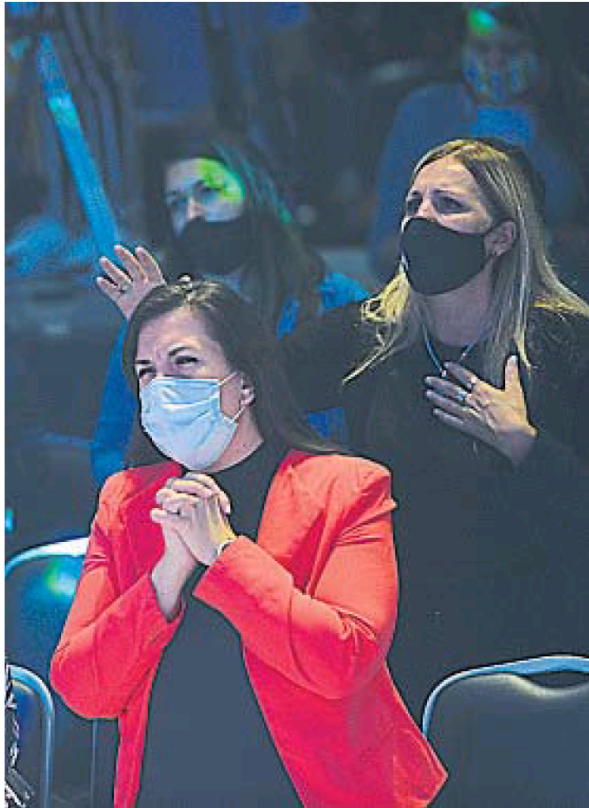
EN EL TEMPLO. El público vivió con devoción las ceremonias de las Pascuas.